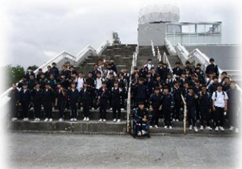
富士山レーダードーム館前にて

その一環として、学校を離れて体験的な学習をする1年生の宿泊学習（林間学校）と2年生の校外学習が、5月19日（1年生は20日までの1泊2日）に実施されました。1年生は清里方面に、2年生は富士山方面に、大型バスに分乗して、それぞれ出かけてきました。出発の朝は、あいにくの曇天ではありましたが、ワクワクが止まらない生徒たちの顔がとても印象的でした。特に2年生は、昨年の宿泊学習が中止になった代替行事ということもあり、本当にうれしそうでした。