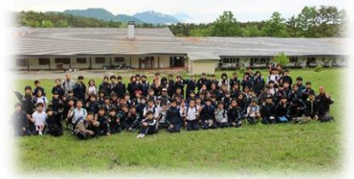
八ヶ岳少年自然の家にて

年度始めのこれらの大きな行事への取り組みは、学年や学級の団結力を高め、協力・責任・思いやりなどの心を育み、基本的な集団としてのルールやマナーを確認できる貴重な時間になります。また、環境を変えて体験学習を行うことで、普段よりも新鮮に、印象深くそれぞれの心に届いていくものです。そして何より、中学校生活の大切な楽しい思い出となります。このような大切な時間が、これ以上奪われないう、コロナ禍の収束を祈るとともに、今できることを考え、工夫する努力を重ねていきたいと思ひます。保護者や地域の皆様も応援のほどをよろしくお願ひいたします。