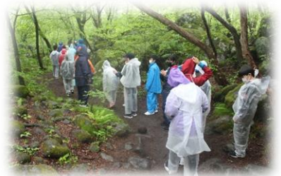
小雨の中 吐竜の滝へ向かう生徒たち