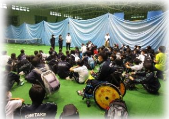
富士山アリーナにて