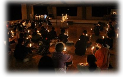
夜はキャンドルサービス