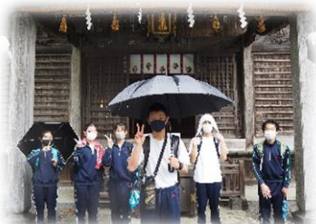
忍野八海・傘を差して班別見学

1年生宿泊学習の1日目は雨のため、予定していた飯盛山ハイキングをとりやめて、翌日に予定していた吐竜の滝を見学し、午後は宿舎（八ヶ岳少年自然の家）の体育館でミニ運動会を行いました。「雨もまた楽しい」の気持ちをもって目一杯に動きました。その夜はキャンドルサービスでした。「静と動」を演出し、笑いあり感動ありのすばらしいプログラムでした。2日目はクラフトで焼き板を体験したり、清泉寮へ行って美味しいソフトクリームを食べたりしました。